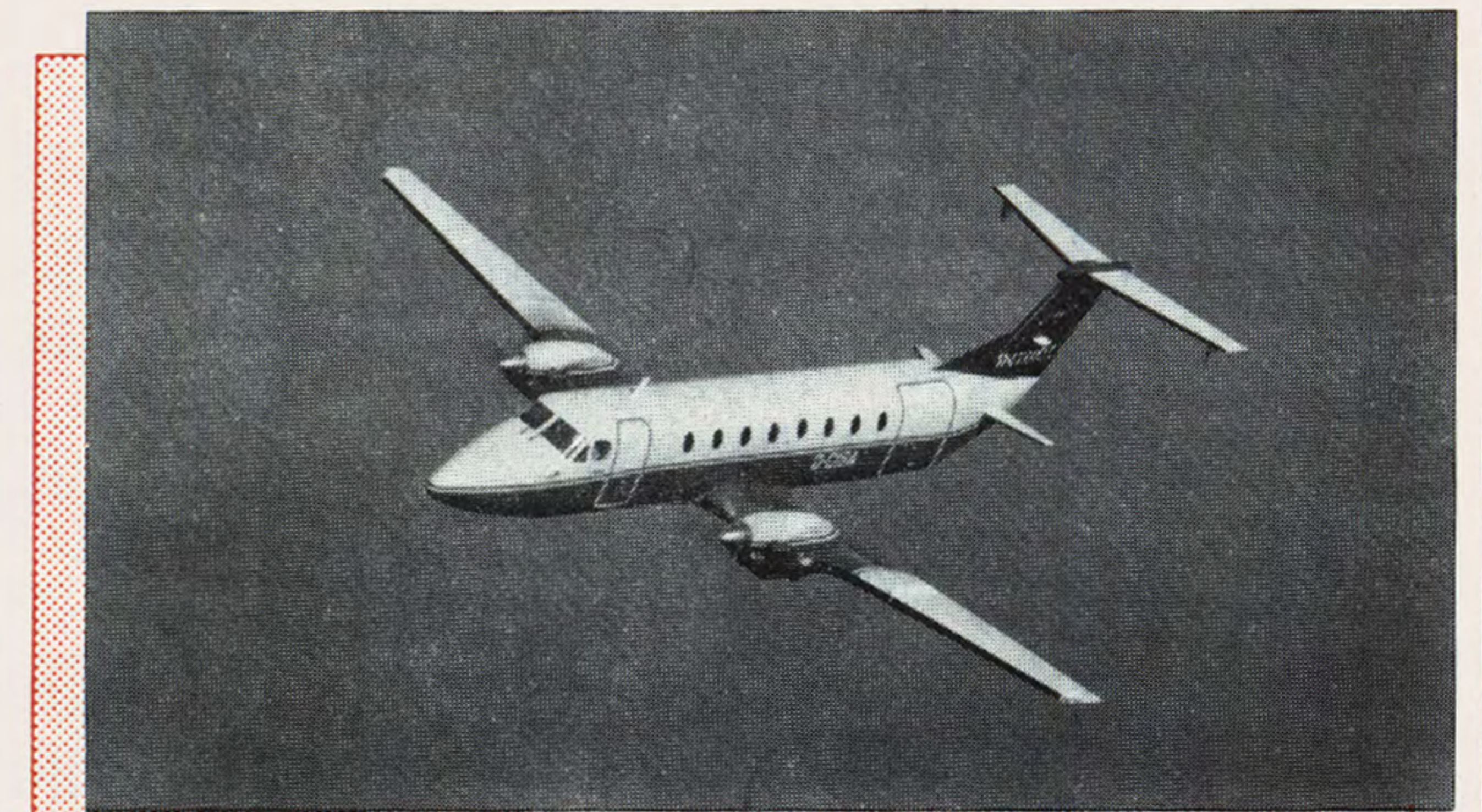
Beechcraft 1900 Airliner, 19 Passagiere, Druckkabine, 500 km/h